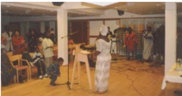
Afrikanere har møte fredag og søndag i Filadelfia, Oslo

http://bki.net er engelsk utgaven av BKI på internett. Ved hjelp av altavistas språkprogram går siden på 8 språk + norsk