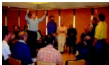
Møtene i Frederikke Kapell samler kristne fra alle kirkesamfunn hver mandag

- Vi har da også bønnemøter fra klokken 16-17 hver fredag, og den akademiske sektoren er da vår bydel, om du vil. Naboene våre er de enkelte instituttene, og på den måten er vi også in-