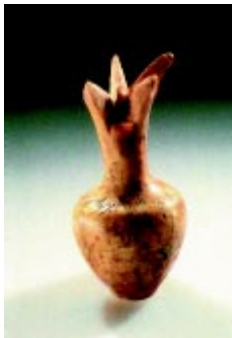
En annen gjenstand man har fra det første tempel er denne vassen som forestiller et granateple.