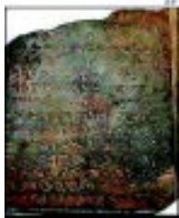
Stentavlen kan være et bevis for at jødernes tempel sto der de muslimske moskeer står idag.

Teksten, som er hamret inn i tavlene på fønikisk, er en ordre fra kongen til prestene om å bruke «hellige penger» til å kjøpe kobber, treverk og stein til oppussing av tempelet, melder NTB.