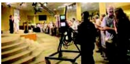
Levende ord sender fra Kråkenes